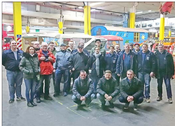
Gruppenfoto mit Führer: Der Besuch des PS-Speichers in Einbeck hat sich für die Neudorf-Platendorfer Feuerwehr gelohnt.

kräftigem Rot – doch neben den ehemaligen Feuerwehrautos gab es noch viele andere teils extrem seltene Wagen von teilweise längst untergegangenen Herstellern zu bewundern. Voller Eindrücke und gut ausgekühlt wurde schließlich der Halle adé gesagt. Bei wärmeren Temperaturen ist sie auf jeden Fall noch mal eine Reise wert. Und auch das Haupthaus mit den PKWs will noch erkundet werden. Dort warten noch einmal rund 500 Fahrzeuge darauf, bestaunt zu werden oder die eine oder andere Erinnerung an vergangene Jahrzehnte wieder zu erwecken.