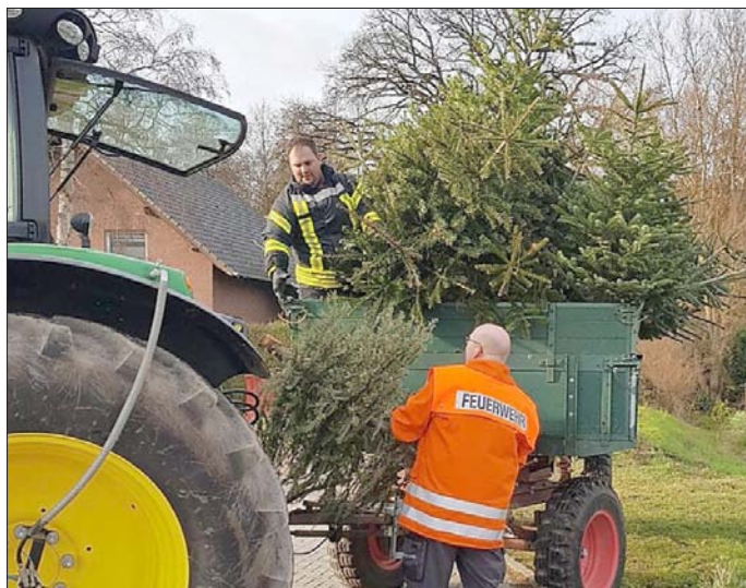
Fleißige Vorarbeit der Jugendfeuerwehr: Die Neudorf-Platendorfer Weihnachtsbäume sind eingesammelt.

Sie hatten sich gequält, stundenlang Bäume geschleppt und sich dafür auch einen tollen Grillnachmittag verdient: Die Neudorf-Platendorfer Jugendfeuerwehr-Kinder haben am Samstag die ausgedienten Weihnachtsbäume eingesammelt.