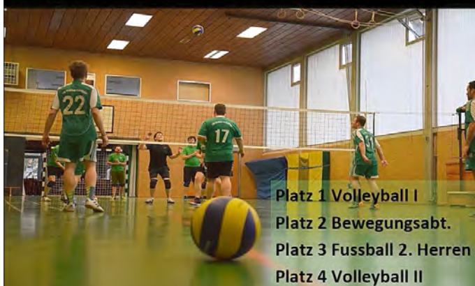
Platz 1 Volleyball I Platz 2 Bewegungsabt. Platz 3 Fussball 2. Herren Platz 4 Volleyball II