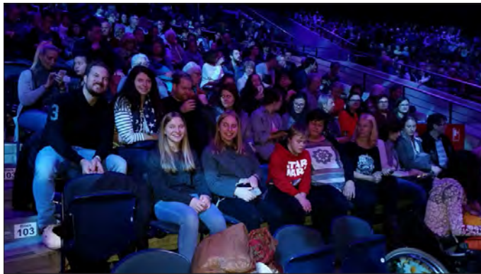
Feuerwerk der Turnkunst 2018

Gleich zu Beginn des Jahres stand die alljährliche Fahrt zum Feuerwerk der Turnkunst nach Braunschweig unter dem diesjährigen Motto Aura auf dem Programm. Das Publikum ließ sich in die Welt des Showturnens entführen. Spitzensportler zeigten sehr eindrucksvolle Darbietungen. Und weil es so schön war freuen wir uns auf 2019 - Tour Connected - Karten gibt es demnächst bei Heike Müller, 0160 950 26 809.