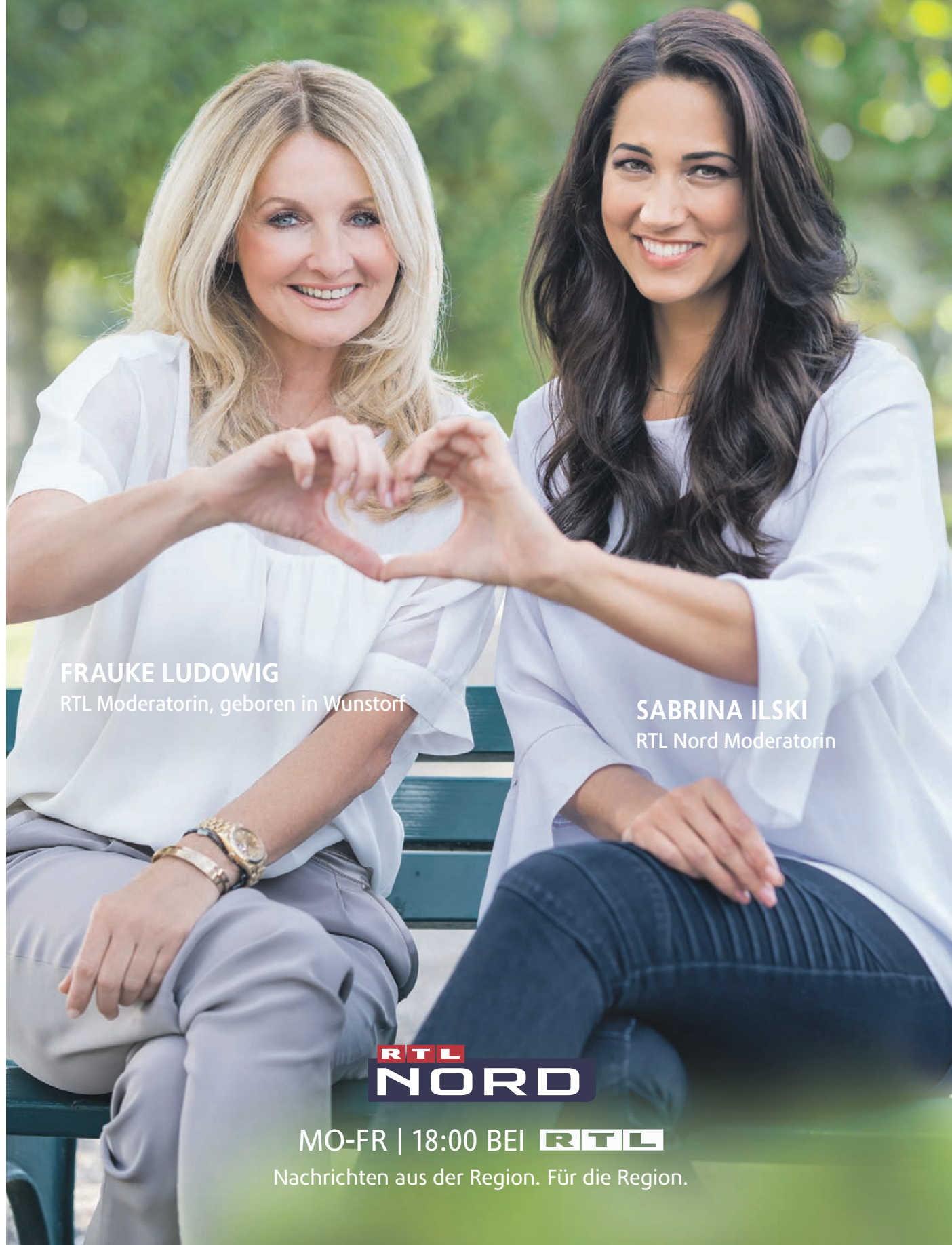
FRAUKE LUDWIG RTL Moderatorin, geboren in Wunstorf