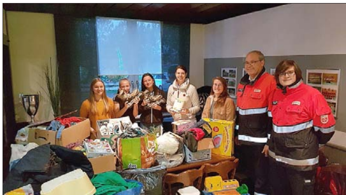
Das Flohmarkt-Team aus dem Kinder- und Jugendsport

TuS Hallenflohmarkt mit 60 Ständen wieder ein voller Erfolg Reibungslos lief der Flohmarkt aus dem Kinder- und Jugendsport Team durch viele fleißige Helfer und Unterstützung der Ortsfeuerwehr. Ganz großen Dank an alle Helfer.