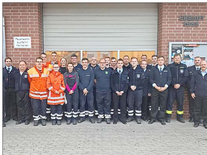
Bestanden: Der Sassenburger Feuerwehrnachwuchs hat seine Truppmann-Prüfungen absolviert.

HERZOGIN-CLARA-STR. 39 · 38442 FALLERSLEBEN · FON: 0 53 62/45 52 · FAX: 0 53 62/36 88 INFO@FARBEN-CENTER.COM · WWW.FARBEN-CENTER.COM · P PARKPLÄTZE DIREKT VOR DEM GESCHÄFT ÖFFNUNGSZEITEN: MO. – FR. VON 8.00 – 12.30 UHR UND 14.00 – 18.00 UHR, SA. VON 9.00 – 13.00 UHR