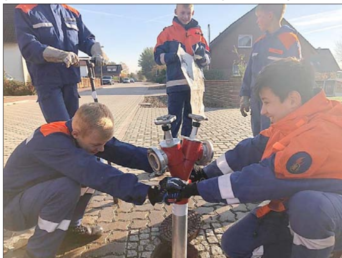
Test bestanden: Die Jugendfeuerwehr half bei der alljährlichen Hydrantenüberprüfung in Neudorf-Platendorf tatkräftig mit.

Angesichts der Ausdehnung des Ortes gibt es in Neudorf-Platendorf reichlich Unterflurhydranten, mehr als in manchem anderen Dorf. Und doch galt es auch diese in diesem Herbst auf ihre Funktion zu überprüfen. Das Besondere hier im Ort: Die Jugendfeuerwehr wird in diese Mammutaufgabe mit eingebunden.