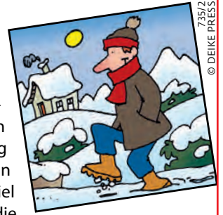
735/2 © DEIKE PRES