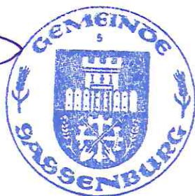
Volker Arms Bürgermeister