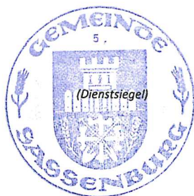
Der Wahlleiter der Gemeinde Sassenburg